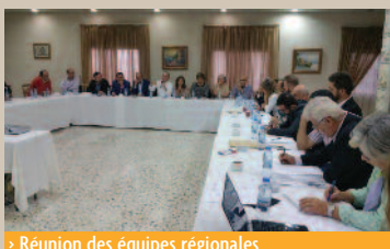
➤ Réunion des équipes régionales