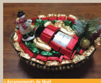
› Arrangements de Noël

Comme d'habitude, le projet de micro-crédit particulier à l'AEP et consistant à faire fabriquer artisanalement du chocolat par des femmes au foyer, a connu un immense succès. Deux mille kilos ont été écoulés pendant la période des fêtes de fin d'année.