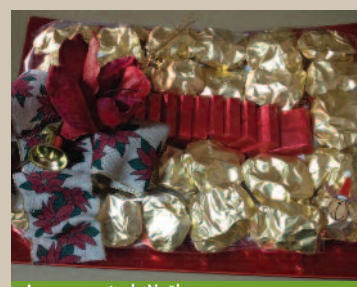
> Arrangements de Noël

Notre Association a participé aux expositions de Noël qui se sont tenues aux Créneaux, au Centre Culturel Français et dans la Crypte Saint-Joseph de l'USJ.