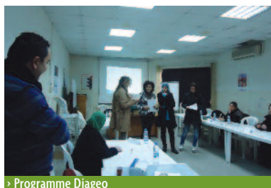
> Programme Diageo