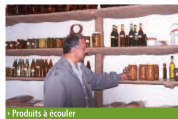
> Produits à écouler