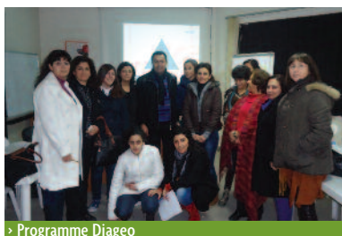
> Programme Diageo

Suite au dossier préparé par l'AEP sur le programme d'émancipation de la femme par l'éducation, notre Association a reçu un montant de 45000 $ offerts par le distributeur de spiritueux Diageo qui consacre une partie de ses rentrées au financement d'institutions de la société civile à travers sa fondation Plan W. Ce programme débutera en 2014.