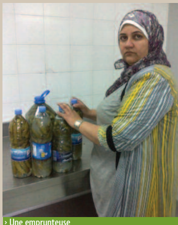
> Une emprunteuse

Bravo aux gagnants et rendez-vous l'année prochaine !