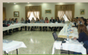
> Réunion des équipes régionales

Une réunion des Equipes Régionales s'est tenue le dimanche 10 novembre 2013 à l'Hôtel Colibri à Baabdat. C'était une réunion fructueuse au cours de laquelle chaque équipe a eu le loisir de présenter sa région.