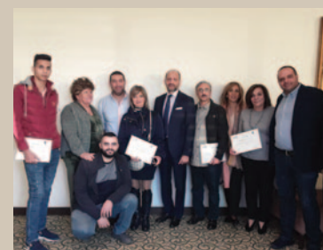
› Les lauréats du prix YMCA