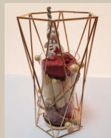
› Les arrangements

Chaque année, AEP renouvelle son engagement aux sept mères de famille qui confectionnent du chocolat artisanal pendant la saison des fêtes. Cette année, 800 kilos de ce délicieux chocolat ont été produits et tous les bénéfices ont été reversés à ces dames.